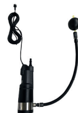
5. 9040 + 7088 Volautomatische onderwaterhydrofoor divertron 900x met aanzuigfilter en zuigslang