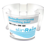
3. 7076 Rustige inloop slim rain 110/125