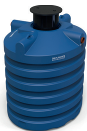
1. 6096 DS7500 regenwaterput 7500L Premium