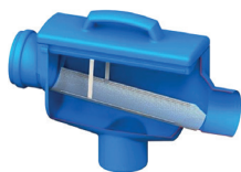
2. 6817 Slim rain budget regenwaterfilter 110